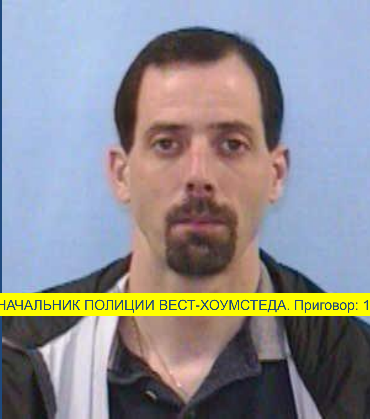
НАЧАЛЬНИК ПОЛИЦИИ ВЕСТ-ХОУМСТЕДА. Приговор: 12 лет